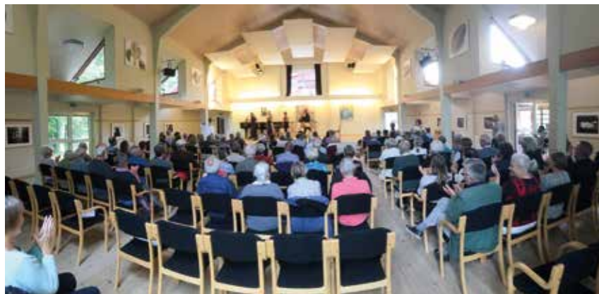
Koncert i John's Hall