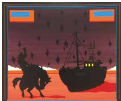
Frodo Mikkelsen. Gave til museet. 2016