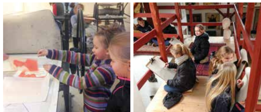
Thy Billedskole laver grafik. Sennels Skole arbejder med portræt